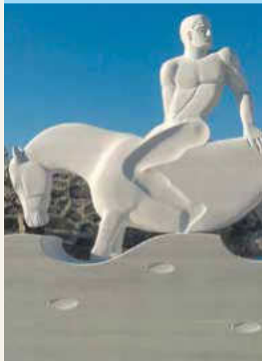
Ausstellung Tanya Preminger