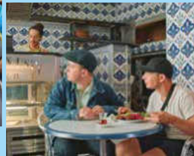
Masel Tov Cocktail