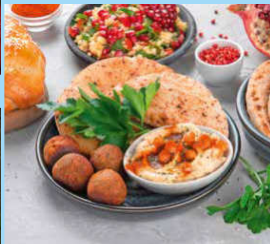
Koch- und Backworkshop