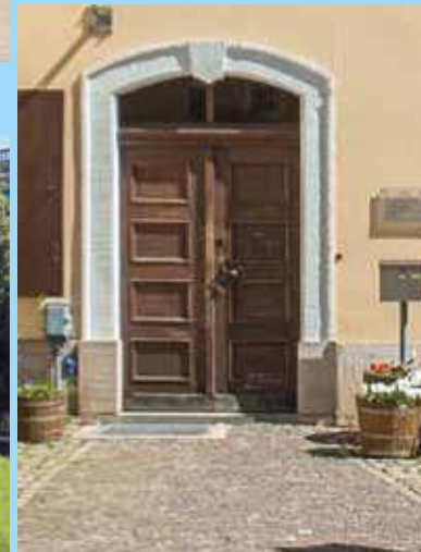
Museum Alte Lateinschule

11. September bis 15. November 2026 Museum Alte Lateinschule