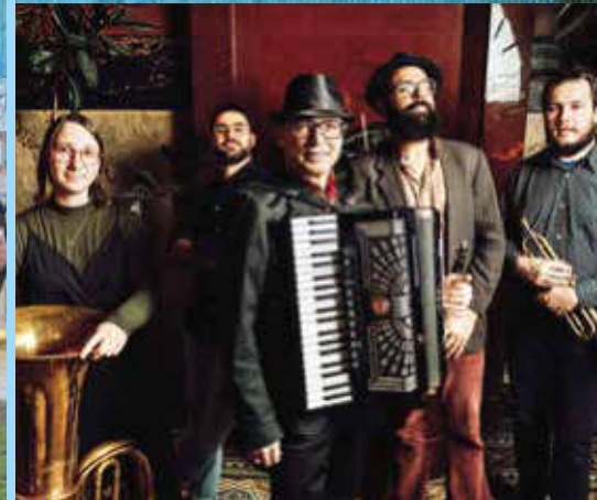
Klezmer Muskel Kater Leipzig