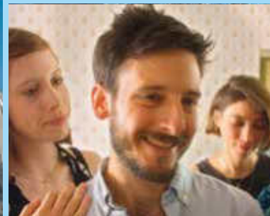
Wir sind wieder da

Anlässlich des Themenjahres hat der Filmverband Sachsen ein Programm zusammengestellt, das unterschiedliche, filmische Perspektiven auf jüdisches Leben, jüdische Geschichte und jüdische Gegenwart auslotet. In rund 65 Minuten entfalten die ausgewählten Filme persönliche, künstlerische und gesellschaftliche Annäherungen an Fragen von Erinnerung, Identität und Zugehörigkeit. Zwischen animierten Bildern, dokumentarischen Momenten und pointiertem Spielfilm erzählen sie von den Nachwirkungen der Schoa, von familiären und inneren Konflikten über Generationen hinweg sowie vom Spannungsfeld zwischen individueller Erfahrung und kollektiver Geschichte. Dabei stehen subjektive Perspektiven, emotionale Zustände und alltägliche Situationen, die jüdisches Leben in seiner Vielfalt sichtbar machen, im Vordergrund.